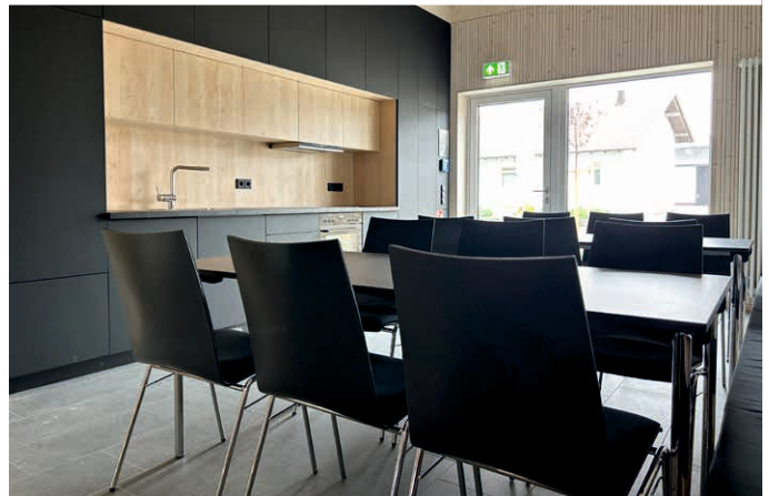
Der Sozialraum bietet nicht nur Platz für gemütliches Beisammensein, sondern auch für Schulungen. In der Werkstatt können Reparaturen vorgenommen werden.