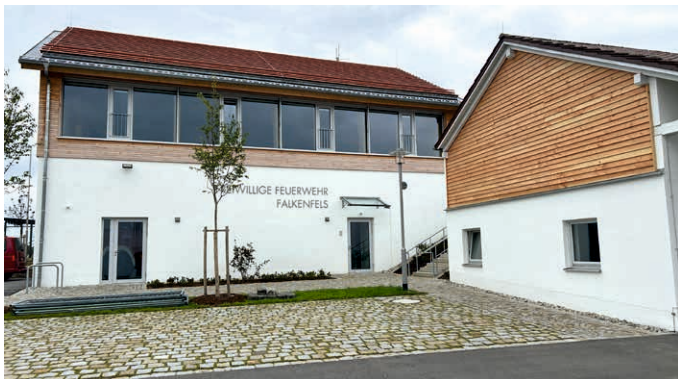
Das neue Feuerwehrgerätehaus ist dort entstanden, wo einst die Turnhalle war.