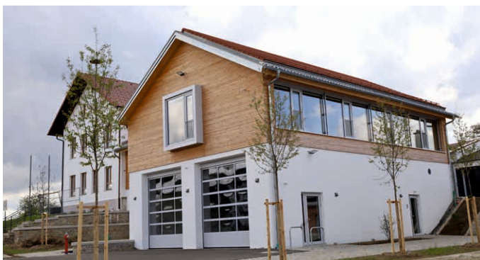
Das neue Feuerwehrgerätehaus bietet Platz für zwei Einsatzfahrzeuge.